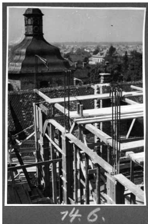
Slika 1: Čadež, VI. Rekonstrukcija Univerzitetne biblioteke po požaru junija 1944 (NUK, Kartografska in slikovna zbirka, sig. Gr III - 209).

vodstvom Melite Pivec - Stele so sestavile začasne kartotečne listke, sestavile so začasno kartoteko ter prenesle knjige iz 1. nadstropja v skladišče v 2. nadstropju. Tako je bilo rešenih 2211 samostojnih knjig, 808 periodik in kontinuand (to je serij in knjižničnih zbirk) s 3787 zvezki, skupaj 5998 zvezkov ter šolska poročila 91 šol (1140 zvezkov). Očistile so tudi okrog 300 knjig, rešenih iz germanističnega, klasičnega in lingvističnega seminarja. Da so delo opravljale v nezakurjenih prostorih, verjetno ni potrebno posebej omenjati. Šele iz tega poročila izvemo, da so bile dragocenosti, ki jih je knjižnica hranila v rokopisni zbirki v četrtem nadstropju, šele po požaru premeščene v kletno zaklonišče. V naslednjih mesecih so bili urejeni ostanki čitalniške (21.000 listov) in strokovne kartoteke (9500 listov), deloma so bile rekonstruirane kartoteke izposojenih knjig po listih v skladiščih in kartoteke priročnih knjižnic (po listih v skladiščih in po spominu). Začeli so z rekonstrukcijo čitalniške kartoteke in starega inventarnega kataloga (prepisane so bile številke od 40.000 do 42.000, ki so bile večinoma še čitljive, ostale signature od 1 do 40.000 pa so rekonstruirali po matični kartoteki) ter z rekonstrukcijo strokovne kartoteke. Da bi lahko nadomestili uničeno knjižnično gradivo, so uredili zbirko dvojnic.